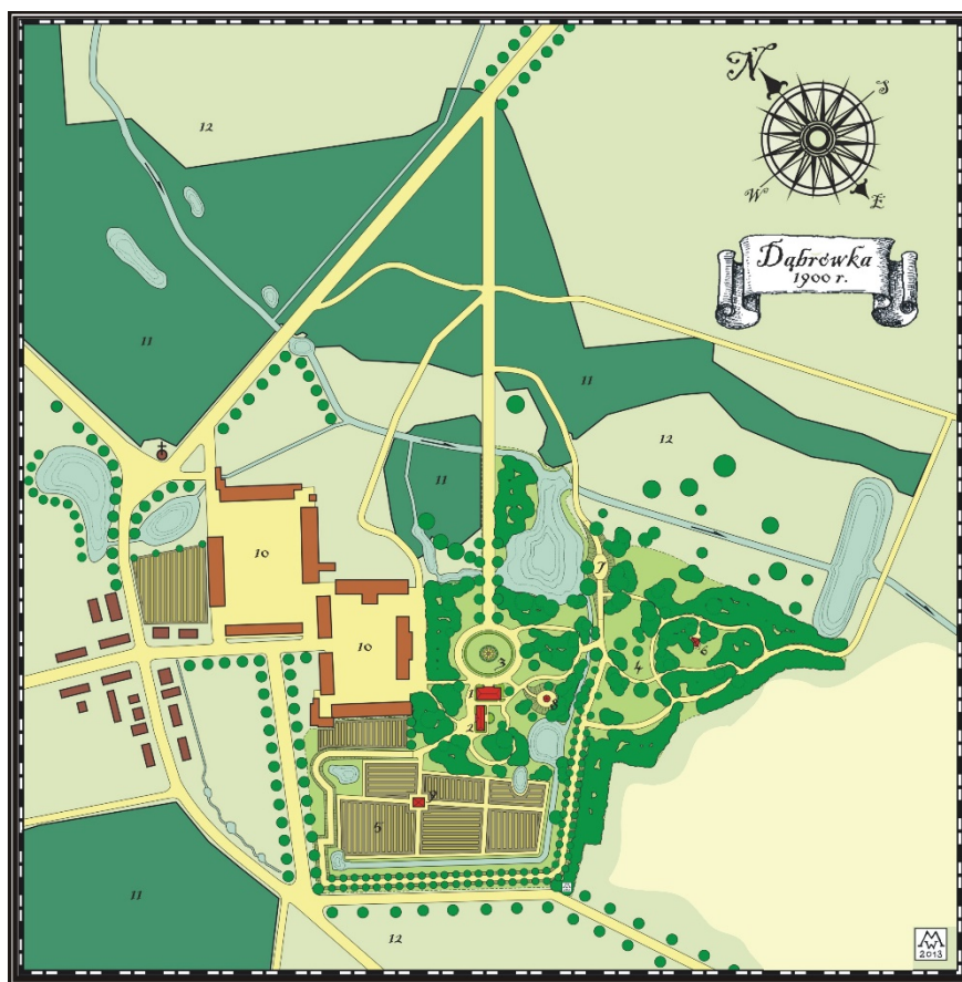
Rys. 2. Ideogram rekonstrukcji kompozycji przestrzennej zespołu pałacowo-parkowego oraz folwarku w Dąbrówce; 1 – pałac, 2 – dwór, 3 – podjazd, 4 – park pałacowy, 5 – ogród użytkowy, 6 – kaplica grobowa, 7 – wzgórze widokowe, 8 – kopiec z altaną, 9 – pawilon ogrodowy, 10 – folwark, 11 – las, 12 – łąki i pola uprawne (oprac. M. Walerzak) Fig. 2. Ideogram presenting reconstruction of spatial composition of palace-park complex and farm in Dąbrówka; 1 – palace, 2 – manor house, 3 – court, 4 – palace park, 5 – vegetables garden, 6 – captel, 7 – view hill, 8 – hill with the pavillion, 9 – garden pavillion, 10 – farm, 11 – forest, 12 – meadows and fields (comp. by M. Walerzak)

w formach klasycystycznych, otoczony niewielkim powierzchniowo parkiem, pozostający w niewyjaśnionych relacjach historycznych z majątkiem w Dąbrówce. Główna droga łącząca Dąbrówkę ze Skórzewem i stacją kolejową na południu zamykała wieś łukiem od strony zachodniej. Od głównej drogi wybiegały podrzędne drogi prowadzące do Zakrzewa i Dąbrowy w kierunku północnym i północno-wschodnim oraz w kierunku południowo-zachodnim do Pałędzia i dalej Konarzewa. Od strony zachodniej obszar wsi i należących do niej terenów uprawnych zamykał kompleks leśny, od południa linia kolejowa, a od wschodu teren zajęty przez zabudowę i park ograniczała dolina Wirynki (rys. 2).