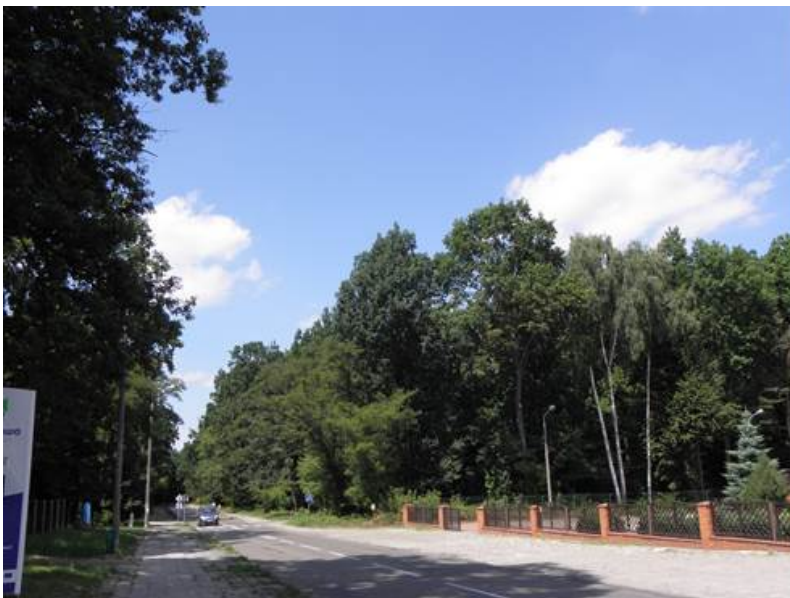
Rys. 6. Las Poniatowa w pobliżu terenu poprzemysłowego (2015 r.)