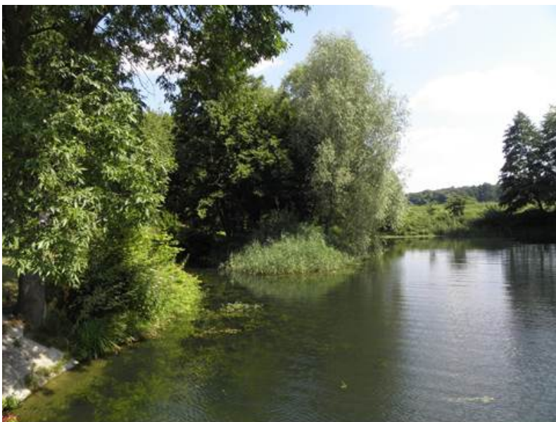
Rys. 7. Odpływ cieków Bezimiennego spod Kraczewic z zalewu miejskiego (2015 r.)