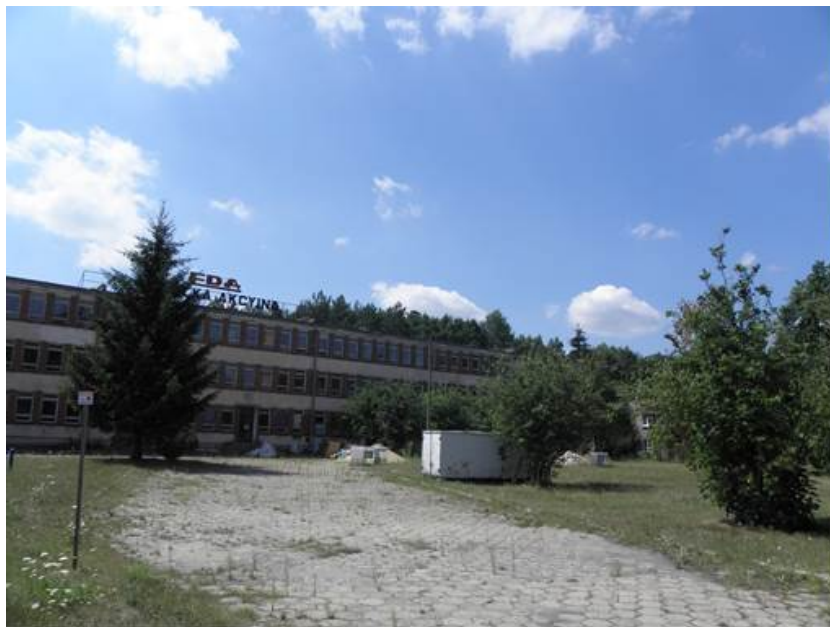
Rys. 3. Budynek po Zakładach Elektromaszynowych EDA S.A. – aktualnie teren po-przemysłowy z roślinnością synantropijną (2015 r.)