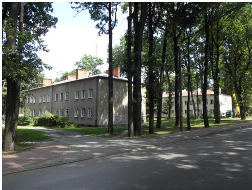
Rys. 1. Stare Miasto z budynkami 2-kondygnacyjnymi (2015 r.)