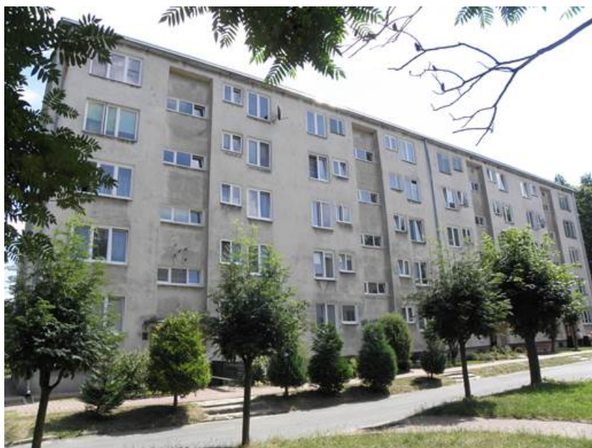
Rys. 2. Nowe Miasto – ul. Bema (2015 r.)