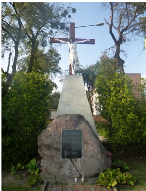
Rys. 4. Krzyż w Potulicach