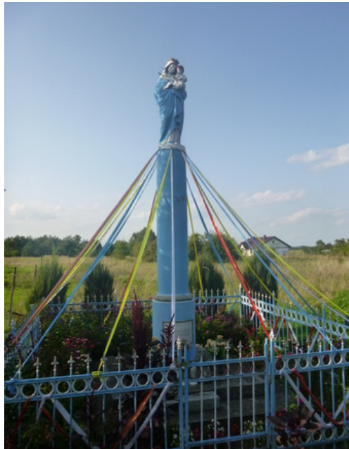
Rys. 2. Figura Matki Boskiej w Kaźmierowie

Połowa odnalezionych krzyży przydrożnych jest wykonana z drewna, trzy z betonu, a dwa z metalu. Wśród figur dominuje postać Matki Boskiej posadowiona na betonowym cokole. Przy większości znajduje się niski metalowy płot, w każdej miejscowości wykończony w inny sposób. Dominującym typem kapliczek są kapliczki słupowe, murowane z cegły lub otynkowane. Wyróżniającym się obiektem jest kapliczka w Chrzęstowie wbudowana w mur okalający posiadłość dworską. Pozostałe różnią się między sobą wielkością, detalem architektonicznym, wykończeniem i barwą. Patronką wszystkich kapliczek jest Matka Boża (tab. 1).