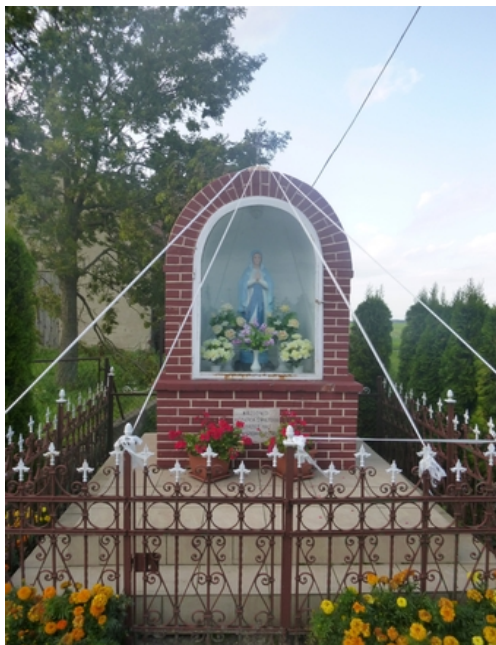
Rys. 3. Kapliczka Matki Boskiej w Małocinie