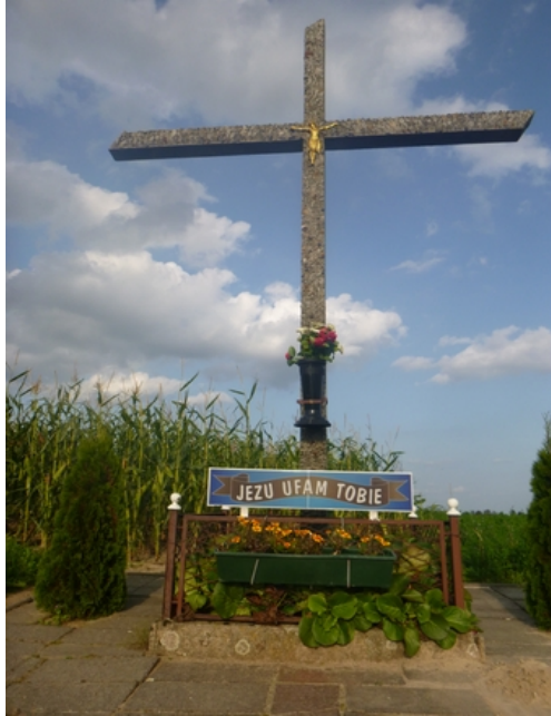
Rys. 5. Krzyż przy drodze pomiędzy Trzeciewnicą a Sucharami (w roku 2016 świerki pospolite zastąpiono żywotnikami w odmianie ‘Smaragd’)

Przy 22 opisanych obiektach sakralnych rosną głównie drzewa i krzewy, w różnych układach i kompozycjach, najczęściej posadzone symetrycznie (tab. 2). Dendroflorę zinwentaryzowanych krzyży, kapliczek i figur cechuje bardzo duża różnorodność. Łącznie oznaczono 39 taksonów należących do 28 rodzajów z 18 rodzin, przy czym prawie 80% rodzajów jest reprezentowanych przez zaledwie jeden gatunek lub odmianę. W przewadze występują rośliny okrytozalążkowe (56% zinwentaryzowanej dendroflory). Z drzew najczęściej odnotowywanymi gatunkami są: świerk pospolity ( Picea abies (L.) H. Karst.), lipa drobnolistna ( Tilia cordata Mill.) i klon pospolity ( Acer platanoides L.). W grupie krzewów dominują bukszpan wieczniezielony ( Buxus sempervirens L.) i żywotnik ( Thuja ) ‘Smaragd’ (tab. 3).