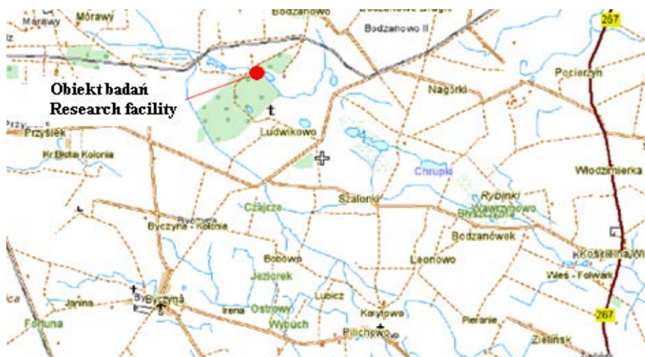
Rys. 1. Położenie terenu badań

Leśnictwo Osięciny znajduje się w Nadleśnictwie Włocławek, w Uroczysku Bodzanowo, w obrębie ewidencyjnym Bodzanowo w gminie Dobrze w powiecie radziejewskim (rys. 1). Zastawkę żelbetową zlokalizowano na cieku, który przepływa przez działkę o powierzchni 33,8 ha, stanowiącą własność Skarbu Państwa. Ciek ten to rów melioracji szczegółowych o długości 1805 m, spadku dna 0,3% i napełnieniu przy zastawce 0,9 m. W punktach zlokalizowanych poza zasięgiem oddziaływania zastawki napełnienie wynosiło 0,4 m. Średnie napełnienie rowu wynosiło 0,3-0,6 m, przy średniej głębokości 1,2 m.