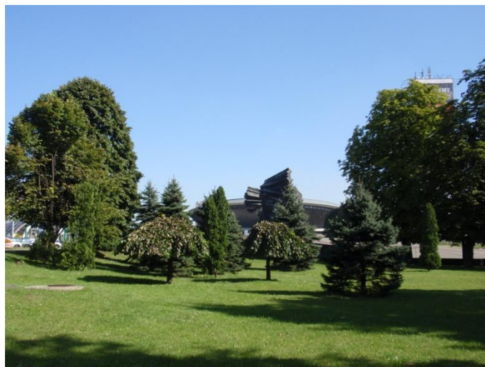
Rys. 3. Katowice, tereny dawnego parku Thiele-Wincklerów