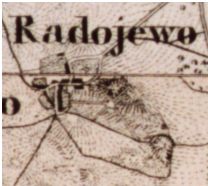
Rys. 3. Radojewo – nadal promienisty układ dróg (mapa topograficzna datowana na lata 1829-1832; GENERALSTABSKARTE... 1847-1863)