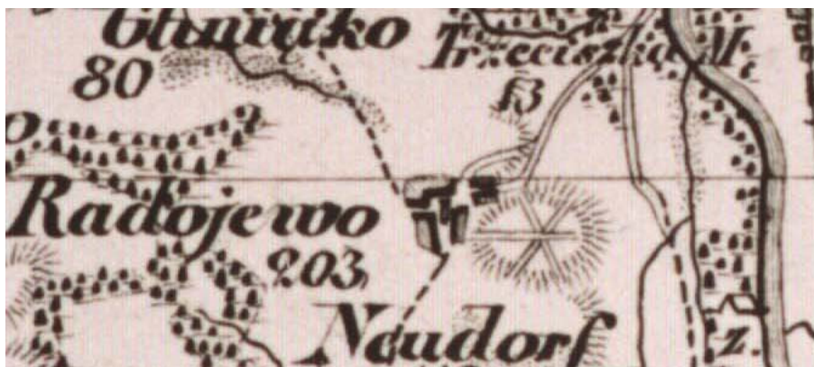
Rys. 2. Powiększenie fragmentu mapy z 1834 roku. Na planie nie widać jeszcze budynku pałacu, jest natomiast promienisty układ dróg spotykających się na wzniesieniu (ATLAS DES REGIERUNGS... 1834)

Zanim powstała kompozycja krajobrazowa parku, cały teren wzniesienia pozbawiony był roślinności wysokiej. Pokazują to wyraźnie zachowane plany (rys. 2 i 3). Następnie powstały drogi w układzie promienistym, schodzące się w jednym miejscu, tworząc prawdopodobnie kolisty plac. Zlokalizowany był on na południowym stoku obecnego parku. Na mapach nie widać jeszcze budynku pałacu, co by oznaczało, że został on wzniesiony najwcześniej po 1829 roku 2 – wkrótce też prawdopodobnie został założony park krajobrazowy.