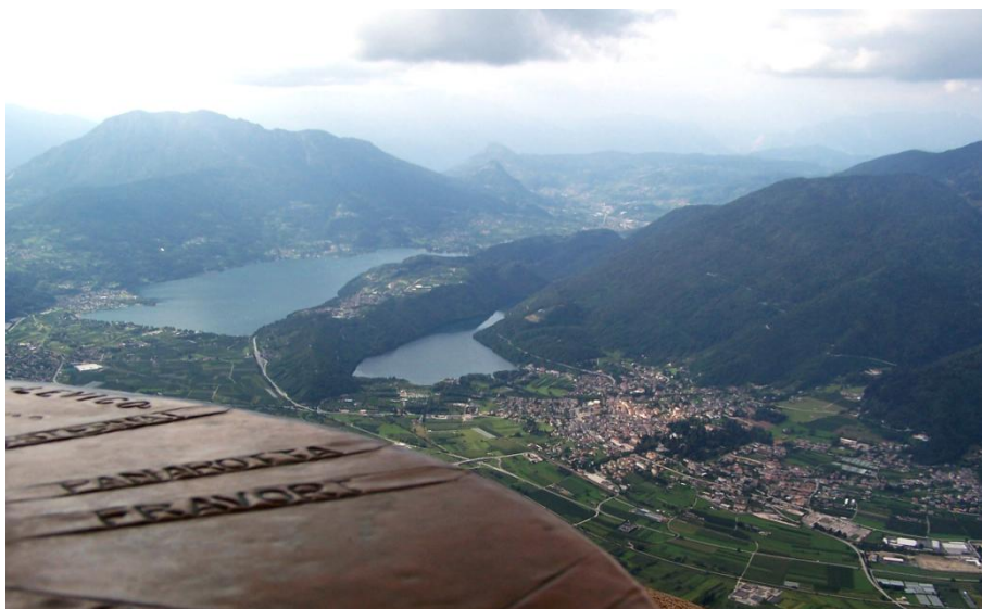
Rys. 5. Widok ze szczytu Vezzena w stronę Trydentu – na jezioro Caldonazzo

Podsumowując, aktywna turystyka forteczna może mieścić się z powodzeniem w nurcie nowoczesnej turystyki zrównoważonej. Jeżeli zgromadzi się także odpowiednią ilość danych statystycznych i socjologicznych, będzie możliwe przeprowadzenie analizy wpływu tej odmiany turystyki na środowisko i krajobraz za pomocą metodologii environmental footprint . Takie badanie z pewnością przyczyniłoby się do zwiększenia jej popularności, a zwłaszcza dostrzeżenia jej wartości w krajach, gdzie, jak np. w Polsce, nie może się doczekać szerokiego uznania i poparcia ze strony oficjalnych organizacji turystycznych czy władz lokalnych i regionalnych.