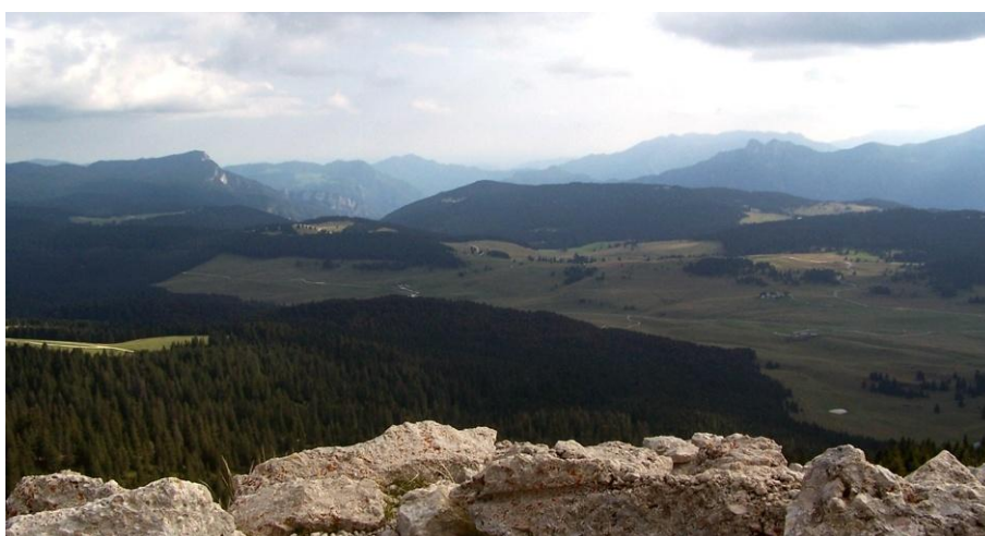
Rys. 2. Widok na przełęcz Vezzena i w kierunku Sette Comuni Fig. 2. View on the Vezzena Pass and towards Sette Comuni

także i Dolomity, jest miejscem uprawiania wycieczkowej turystyki górskiej i wspinaczkowej. Tymczasem turystyka kulturowa, związana z treściami historycznymi w całej Europie, zaczyna nabierać znaczenia. Jako przykład można podać działalność Europejskiego Instytutu Szlaków Kulturowych (The European Institute of Cultural Routes) z jego promocją transeuropejskich szlaków tematycznych. W przypadku włoskich Alp możliwość rozwoju turystyki, opartej na poznawaniu zasobów historycznych i kulturowych krajobrazu, jest szansą rozwoju, zwłaszcza dla mniej znanych miejscowości leżących na uboczu tradycyjnych ośrodków wypoczynkowych z bogatą infrastrukturą wyciągów narciarskich. Przez takie miejscowości prowadzą znakowane szlaki turystyki kulturowej, związanej z frontem alpejskim I wojny światowej, takie jak Sentiero della Pace czy szlak Grande Guerra.