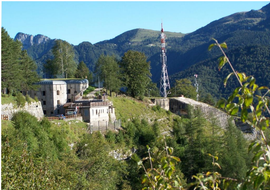
Rys. 3. Fort Belvedere-Gschwendt oraz Alpe Fiorentini i Frotte z włoskim fortem Campomolon

Aby dokonać pomiarów skutków (w domyśle: szkód) działalności człowieka w środowisku przyrodniczym (OLSZEWSKI 2007), opracowano tzw. metodę „ekologicznego odcisku stopy” ( environmental footprint – EF). Wyczerpania te wskazują na to, że ludzkość szybciej konsumuje zasoby przyrodnicze niż są one w stanie się odnawiać. Wskaźnik ten jest używany także do pomiarów skutków uprawiania turystyki na konkretnych obszarach (HUNTER i SHAW 2007). Taki pomiar bierze pod uwagę wszystkie obciążenia dla środowiska i przekłada je na liczbę zużywanych globalnych hektarów, pokazując, jaki obszar jest wykorzystywany do zaspokojenia naszych potrzeb. Liczba ta wynika z obliczeń wykonanych z danych statystycznych, dotyczących ilości wyprodukowanych śmieci, używanych środków transportu, zużycia wody i energii, szkodliwych substancji emitowanych w powietrze, ścieków a także innych mierzalnych śladów bytności ludzkiej w przyrodzie.