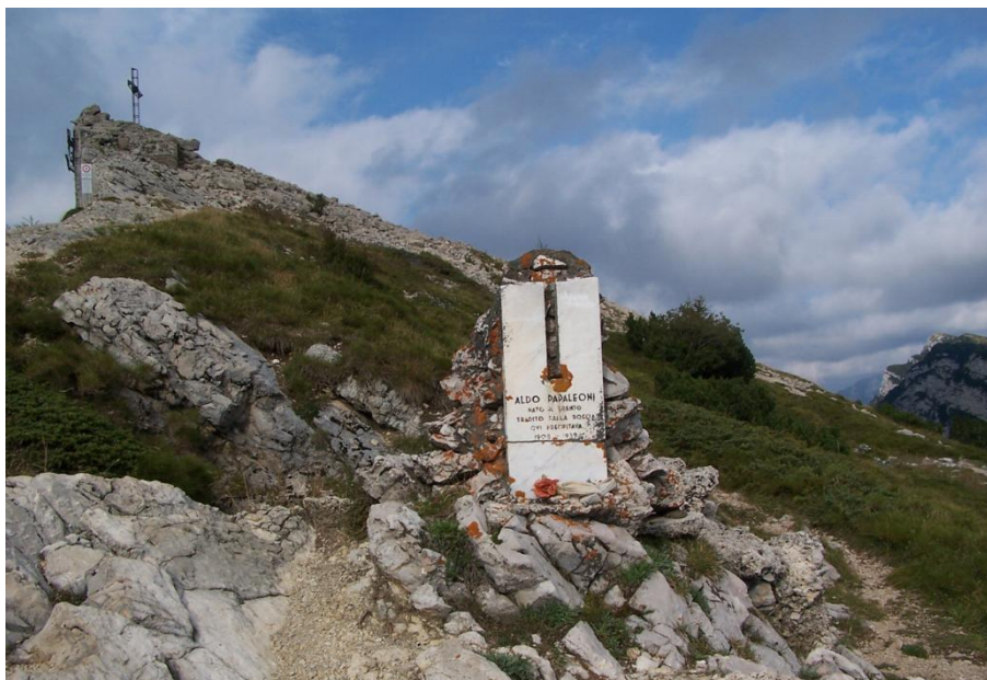
Rys. 4. Ruiny fortu Vezzena zwanego „okiem Altipiani”

Badania Adventure Travel Trade Association (ATTA) – amerykańskiej organizacji zajmującej się organizacją, wspieraniem i promocją turystyki przygodowej – prowadzone wspólnie z firmami konsultingowymi w USA, dotyczące tej gałęzi turystyki, wskazują na stały wzrost liczby turystów aktywnych. Poszerza się także ich profil wiekowy, obejmując coraz częściej studentów podróżujących w trakcie roku wolnego między ukończeniem szkoły a podjęciem studiów oraz całe rodziny z dziećmi. W szerokim kontekście wzrostu zainteresowania turystyką kulturową i przygodową notuje się tendencję do redukcyjnego podejścia do własnych potrzeb, co w uprawianiu turystyki przejawia się ograniczaniem nakładów i pozostawianych po sobie śladów do minimum, przy maksimum doznań, przeżyć i wrażeń. Wzrost popularności aktywnej turystyki kulturowej potwierdzają w skali mikro statystyki z Małopolskich Dni Dziedzictwa, prowadzone przez Małopolski Instytut Kultury w Krakowie (dane z wywiadu z koordynatorką projektu).