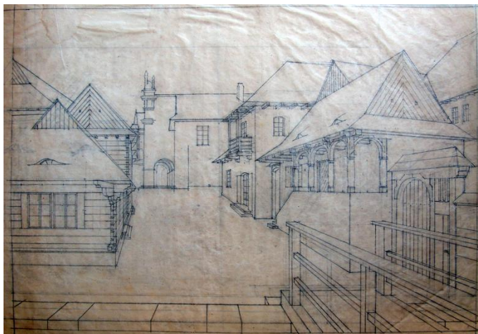
Ryc. 3. Projekt regulacji rzeki Grodarz autorstwa Karola Sicińskiego Fig. 3. The project of Grodarz control by Karol Siciński