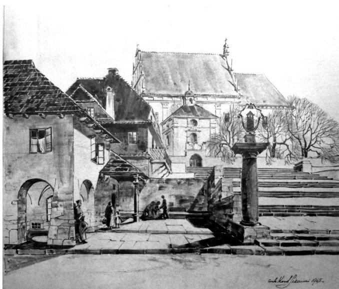
Rys. 5. Projekt przebudowy Rynku w Kazimierzu Dolnym. Rysunek Karola Sicińskiego Fig. 5. Renovation project of Market Square in Kazimierz Dolny, by Karol Siciński

Malownicze położenie Kazimierza przyciągało wielu artystów. Pierwszy plener malarski zorganizowany został w 1909 roku przez Władysława Ślewińskiego. W kolejnych latach pojawiało się coraz więcej takich inicjatyw, m.in. od 1925 roku odbywały się plenery młodzieży malarskiej. Tworzyli tu członkowie Bractwa Świętego Łukasza założonego przez Tadeusza Prusza. Miasto było postrzegane jako tzw. kolonia artystów.