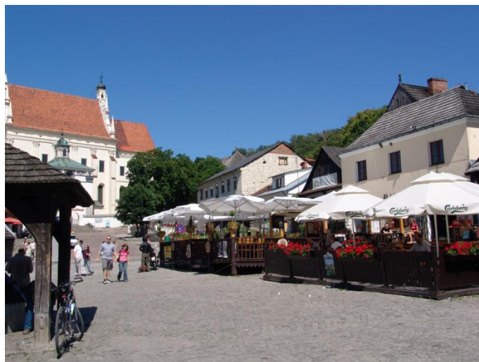
Rys. 1. Rynek w Kazimierzu Dolnym