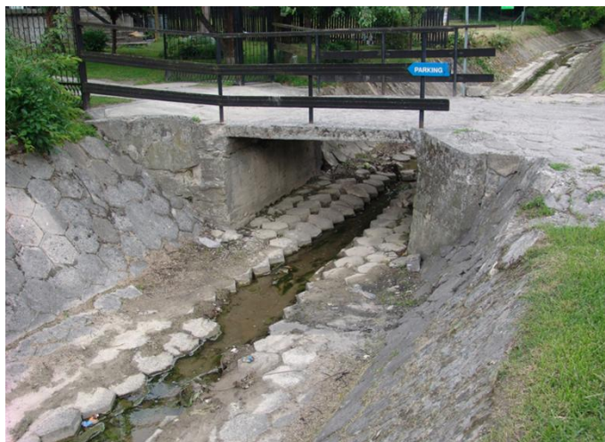
Rys. 2. Żelbetowa kładka na rzece Grodarz Fig. 2. Concrete footbridge over the river Grodarz

trowych pionowych ścianach, wzmocnionych murem kamiennym. Jest to jedno z gorszych rozwiązań technicznych, zupełnie niedopuszczalnych z punktu widzenia ochrony krajobrazu. W zapisach Miejsowego Planu Zagospodarowania Przestrzennego miasta przewidziana została rewitalizacja krajobrazowa i przyrodnicza rzeki Grodarz (UCHWAŁA Nr VI/29/2003).