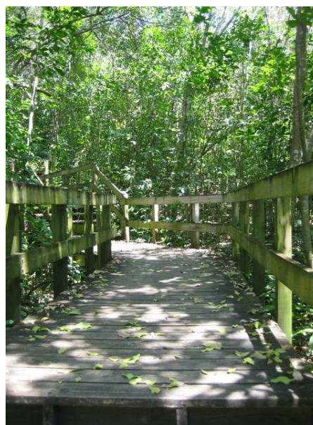
Rys. 3. Drewniane pomosty pomiędzy domkami letniskowymi Stanleya Selenguta (www.usvi.net)

Fig. 2. A view from a holiday bungalow elevated wooden paths (www.usvi.net)