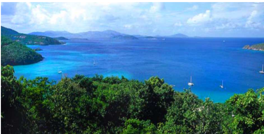
Rys. 1. Krajobraz Wysp Dziewiczych ( www.usvi.net )