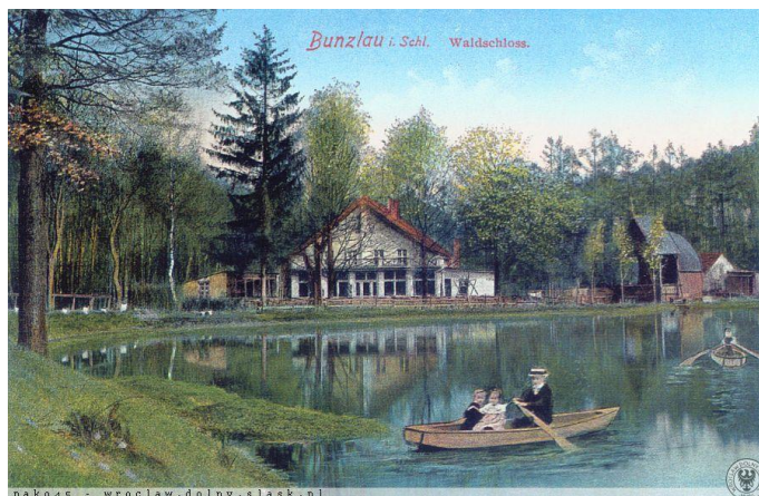
Rys. 2. Widok na staw i Leśny Zamek, około 1913 roku

W drugiej połowie XIX wieku rozpoczęto proces przekształcania lasu w atrakcyjne miejsce rekreacji. Od lat siedemdziesiątych XIX wieku projektantem zmian był malarz Scholtz. W 1874 roku w północno-zachodniej części lasu wytyczono aleje spacerowe oraz utworzono niewielki staw z umieszczoną pośrodku wysepką. Po drugiej stronie drogi, dzięki przegrodzeniu Leśnego Strumienia 6 , dotychczasową łąkę zamieniono na okazały staw 7 . Nad brzegiem zbiornika wzniesiono restaurację „Leśny Zamek” 8 wraz z zabudowaniami niewielkiej muszli koncertowej oraz budynkami przystani. Stosunkowo bliskie sąsiedztwo centrum miasta oraz liczne i zróżnicowane atrakcje, m.in. możliwość pływania łódkami, spacerowania wytyczonymi alejami po starannie utrzymanym lesie oraz sąsiedztwo restauracji, przyczyniły się do dużej popularności miejsca.