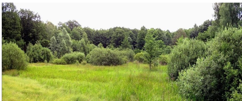
Rys. 3. Widok na staw, 2005 rok

W podszyciu występuje kruszyna pospolita ( Frangula alnus ), lokalnie w runie: barwinek pospolity ( Vinca minor ), bluszcz pospolity ( Hedera helix ), widłak goździsty ( Lycopodium clavatum ), marzanka wonna ( Galium odoratum ) oraz grzyby wielkoowocnikowe. Na obszarze dawnego stawu występują obecnie siedliska roślinności terenów podmokłych.